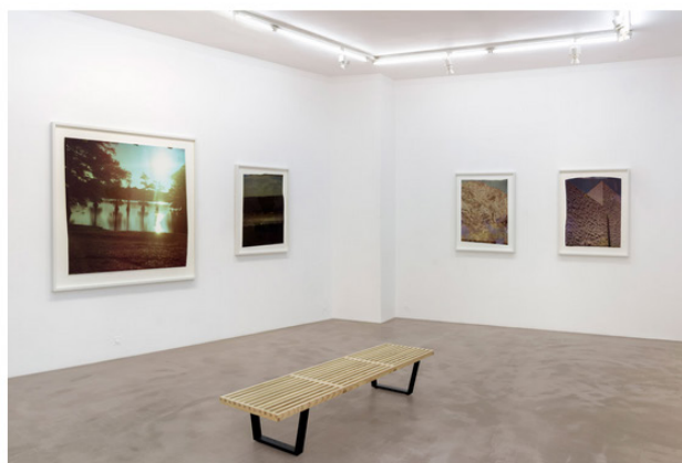
Installation, Exposition John Chiara

NextLevel accueille jusqu'au 4 juin la première monographie à Paris de l'artiste John Chiara , qui constitue également sa première exposition personnelle en Europe. John Chiara (américain, né en 1971, vit et travaille à San Francisco) repousse les limites du médium photographique par son choix de procédé et la maîtrise de ses possibilités. Son approche se distingue par son incroyable matérialité et rappelle les prémices du médium photographique, lorsque les artistes étaient confrontés à un équipement lourd et peu pratique, demandant de longs temps d'exposition ainsi que de longs délais de développement. Son appareil photographique, qu'il a conçu et construit lui-même, est transporté à l'aide d'une remorque à plateau pour produire des images uniques de grands formats.