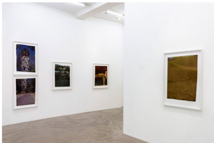
Installation, Exposition John Chiara