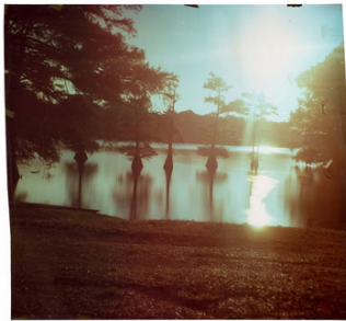
John Chiara Horseshoe Ramp at Mississippi, 2015 série Mississippi Image sur papier Ilfochrome 163....

26 MAI 2016 - FRANCE , ECRIT PAR PATRICE HUCHET