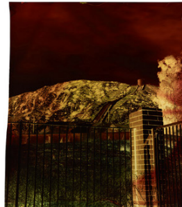
John Chiara Foothill at Balboa, (Variation B), 2012 série Los Angeles Image sur papier Endura tran...