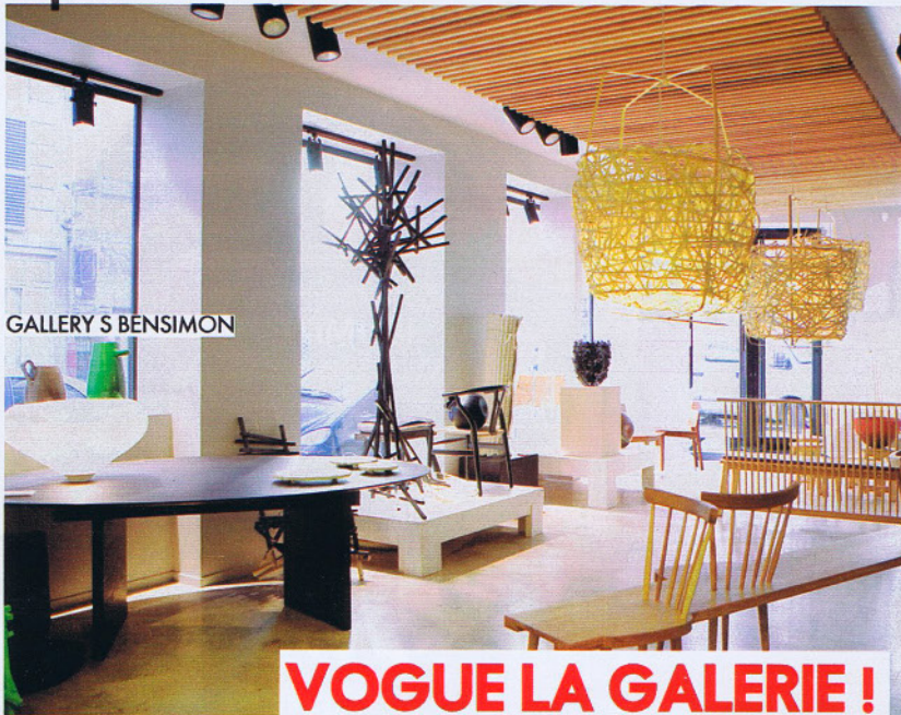
GALLERY S BENSIMON