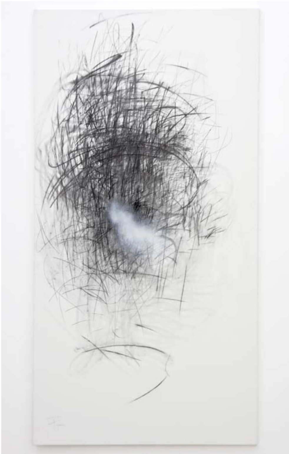
Agnès PEZEU Portrait #1 , 2013 Graphite et bombe sur toile 195 x 107 cm