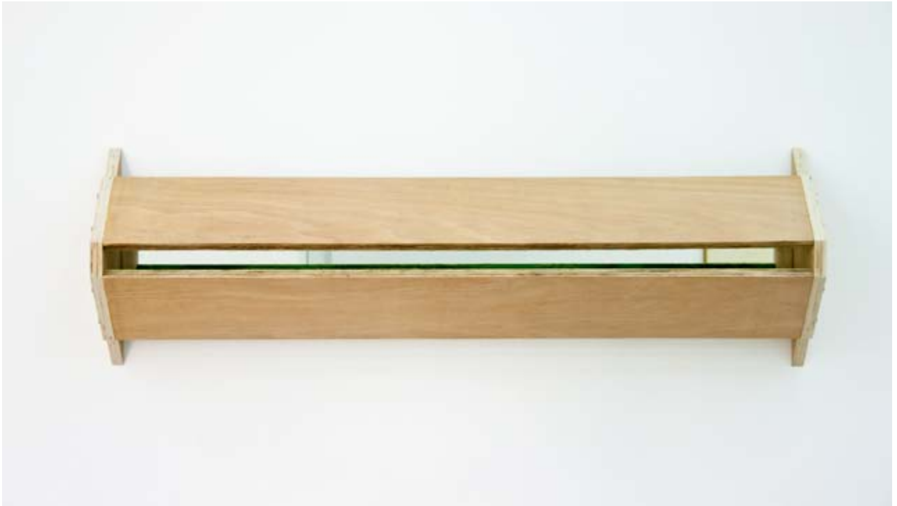
Guillaume LIFFRAN Horizon de Syrthe , 2013 Technique mixte 106 x 40 x 20 cm