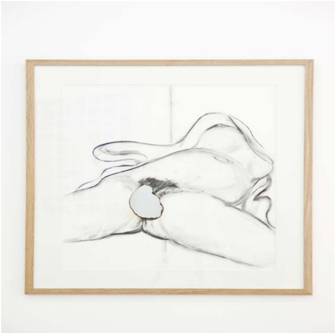
Etienne ZUCKER, The truly face #2 Technique mixte 81 x 66 cm