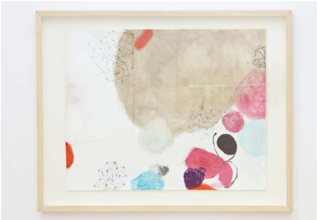
Saraswati GRAMICH Agglomération 4 , 2013 Huile et crayon sur papier 50 x 65 cm