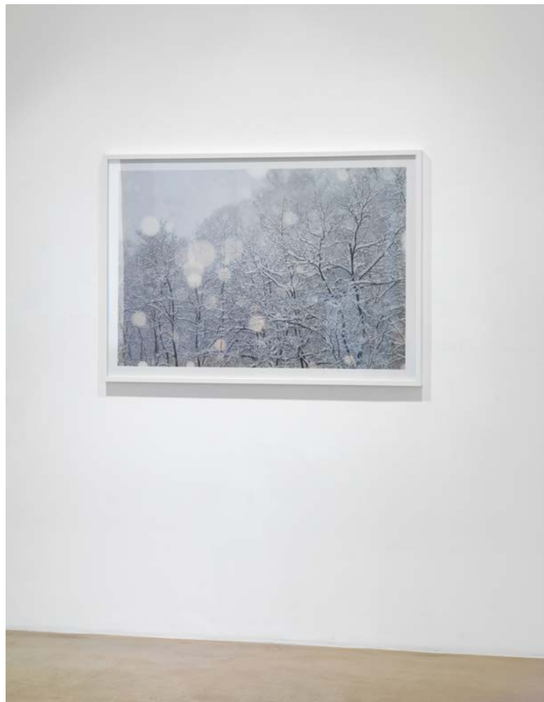
Installation views, Asako Shimizu, Storyteller , 2015, NextLevel Galerie