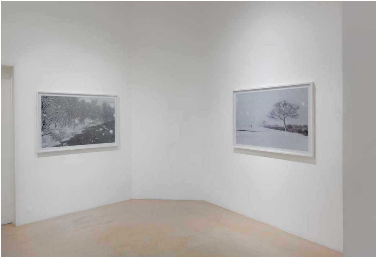
Installation views, Asako Shimizu, Storyteller , 2015, NextLevel Galerie