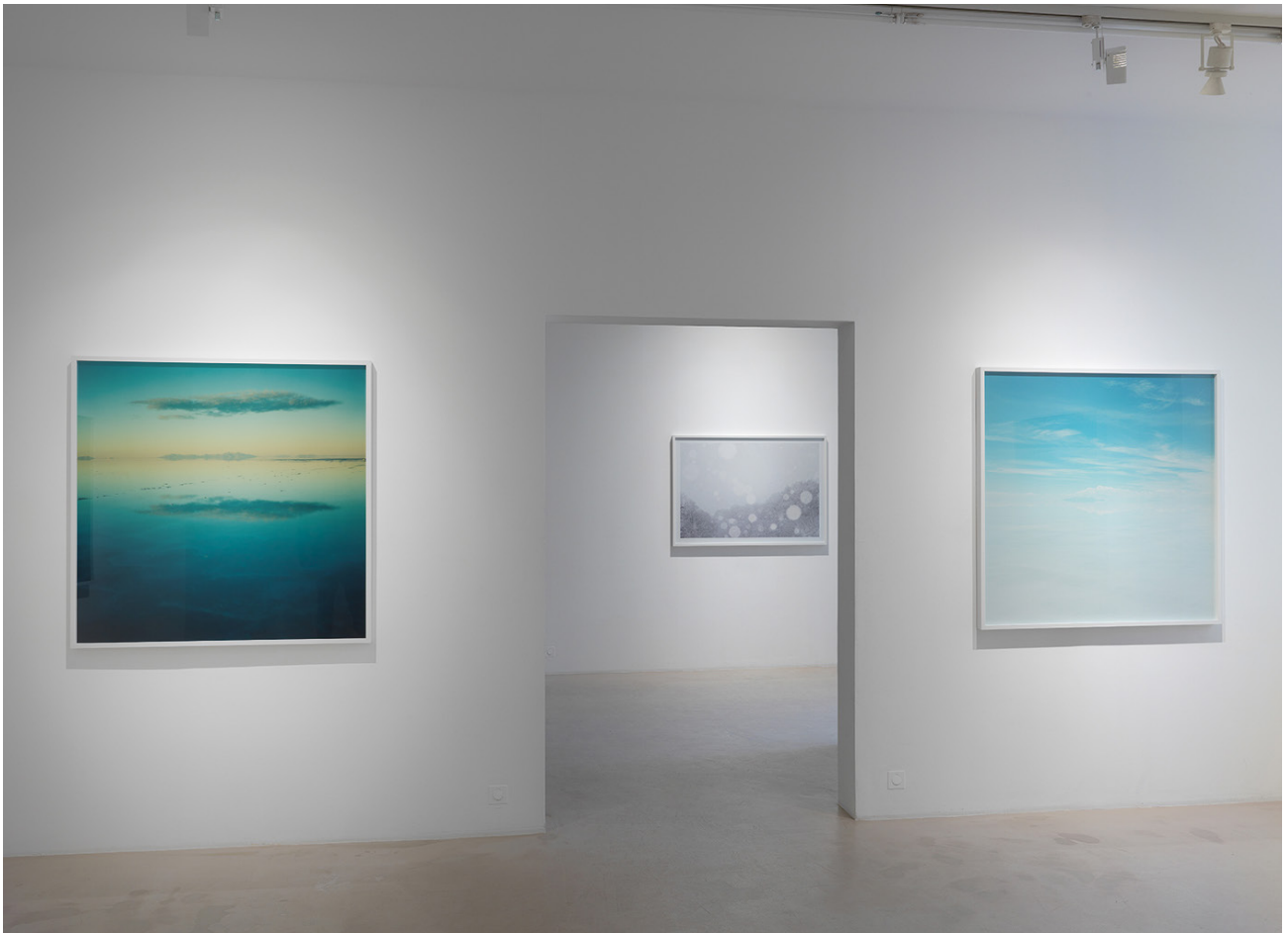
Installation views, Asako Shimizu, Featured works : On Her Skin , 2015, NextLevel Galerie