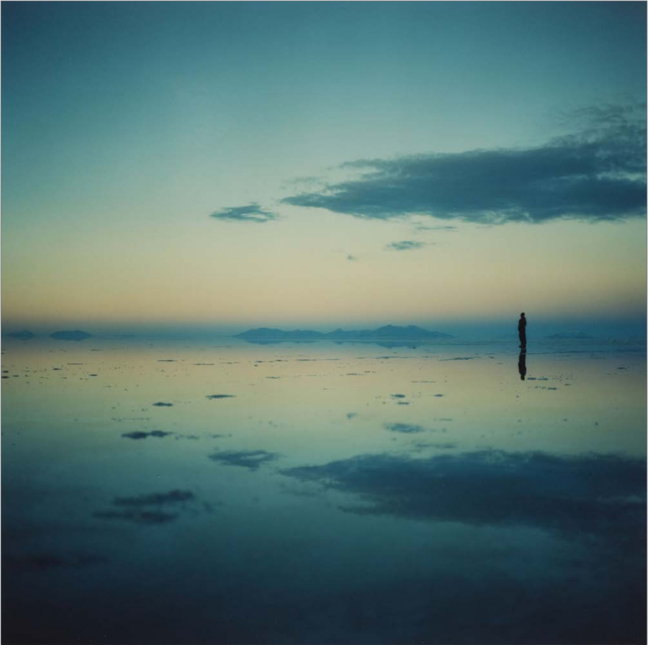
On Her Skin #6, 2006

Épreuve chromogénique couleur 120 x 120 cm - Edition de 5 60 x 60 cm - Edition de 10