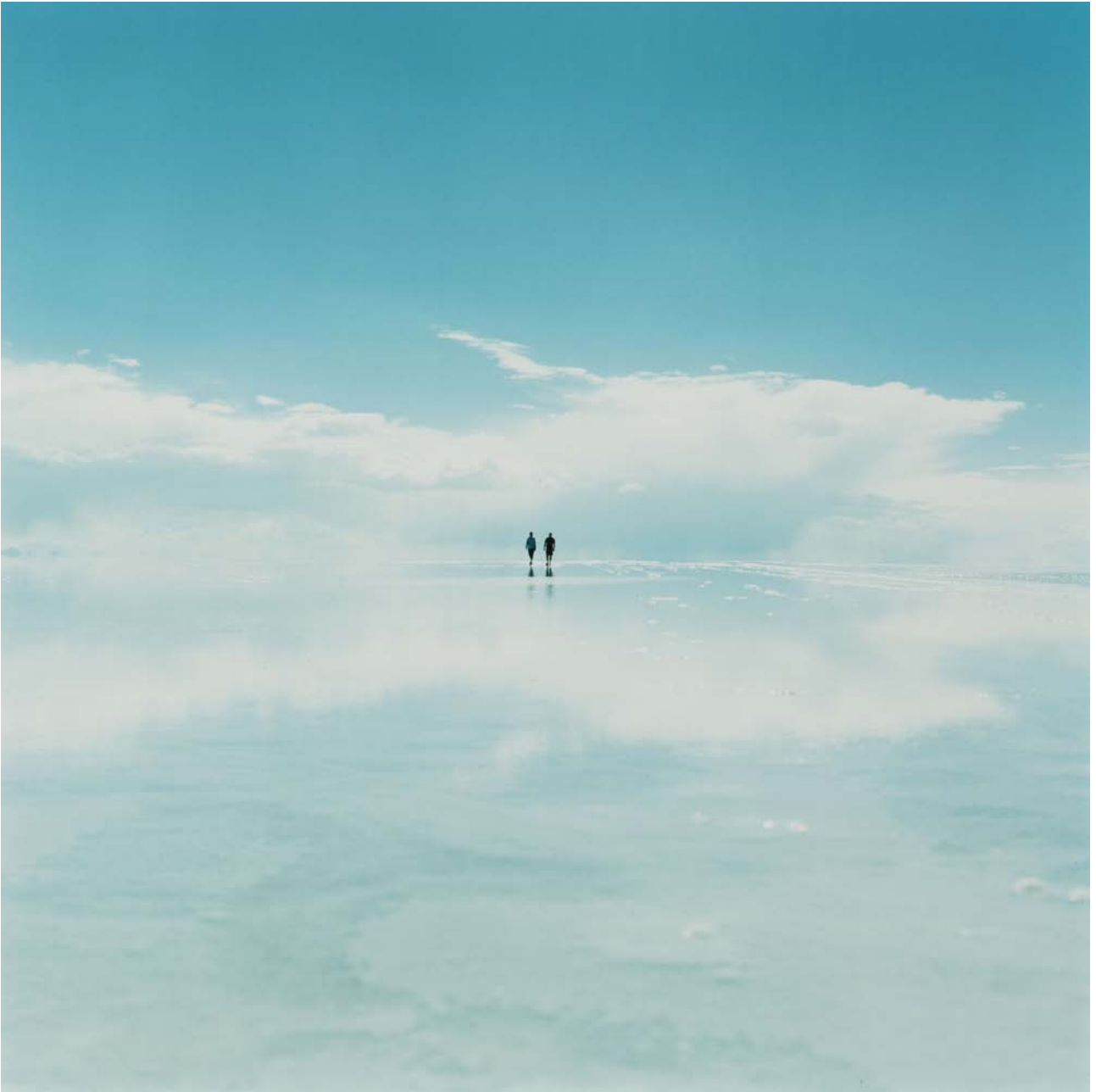
On Her Skin #1, 2006

Épreuve chromogénique couleur 120 x 120 cm - Edition de 5 60 x 60 cm - Edition de 10